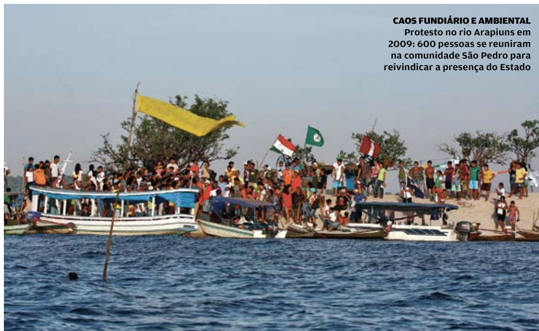
CAOS FUNDIÁRIO E AMBIENTAL Protesto no rio Arapiuns em 2009: 600 pessoas se reuniram na comunidade São Pedro para reivindicar a presença do Estado

Para a Funai, não está em questão a autenticidade da reivindicação dos índios. “Não cabe ao Estado, ou à Funai, dizer quem é índio e quem não é”, afirma Márcio Meira, presidente da entidade