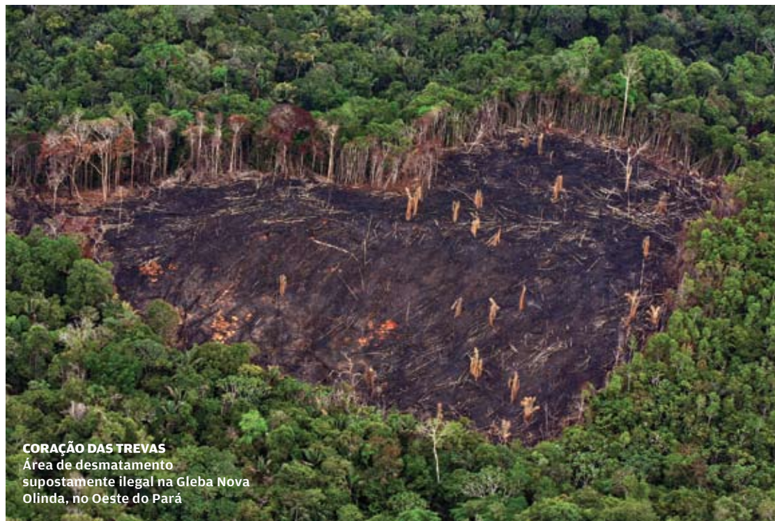
CORAÇÃO DAS TREVAS Área de desmatamento supostamente ilegal na Gleba Nova Olinda, no Oeste do Pará